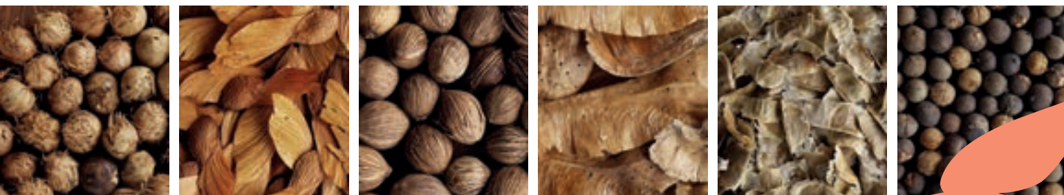
Da esquerda para a direita: sementes de açaí, amendoim bravo, bacaba, amargoso, ipê amarelo da mata e açaizinho do brejo.